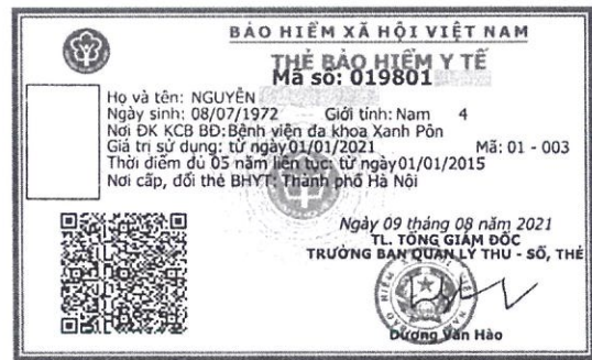
Mẫu thẻ BHYT mới